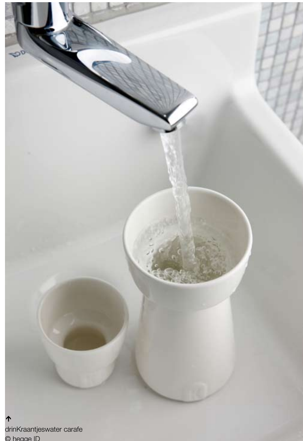
↑ drinKraantjeswater carafe © hegge ID

hegge ID est fier d'avoir ainsi déjà pu concevoir toute une série de produits esthétiques et durables. Par exemple, l'entreprise a conçu une carafe à eau durable pour REcentre. Pour soutenir l'action drinKraantjeswater, une carafe durable était recherchée. Un concours a été lancé et parmi les projets remis, c'est la carafe de hegge ID qui a gagné. « Il était important que la carafe soit belle mais aussi que les coûts de production ne soient pas trop élevés. Pour