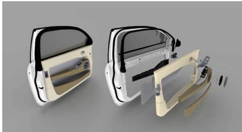
↑ Light Weight Door

des raisons techniques et éthiques, nous avons choisi de la porcelaine d'hôtel. La carafe a été produite par Berghoff, une entreprise limbourgeoise. »