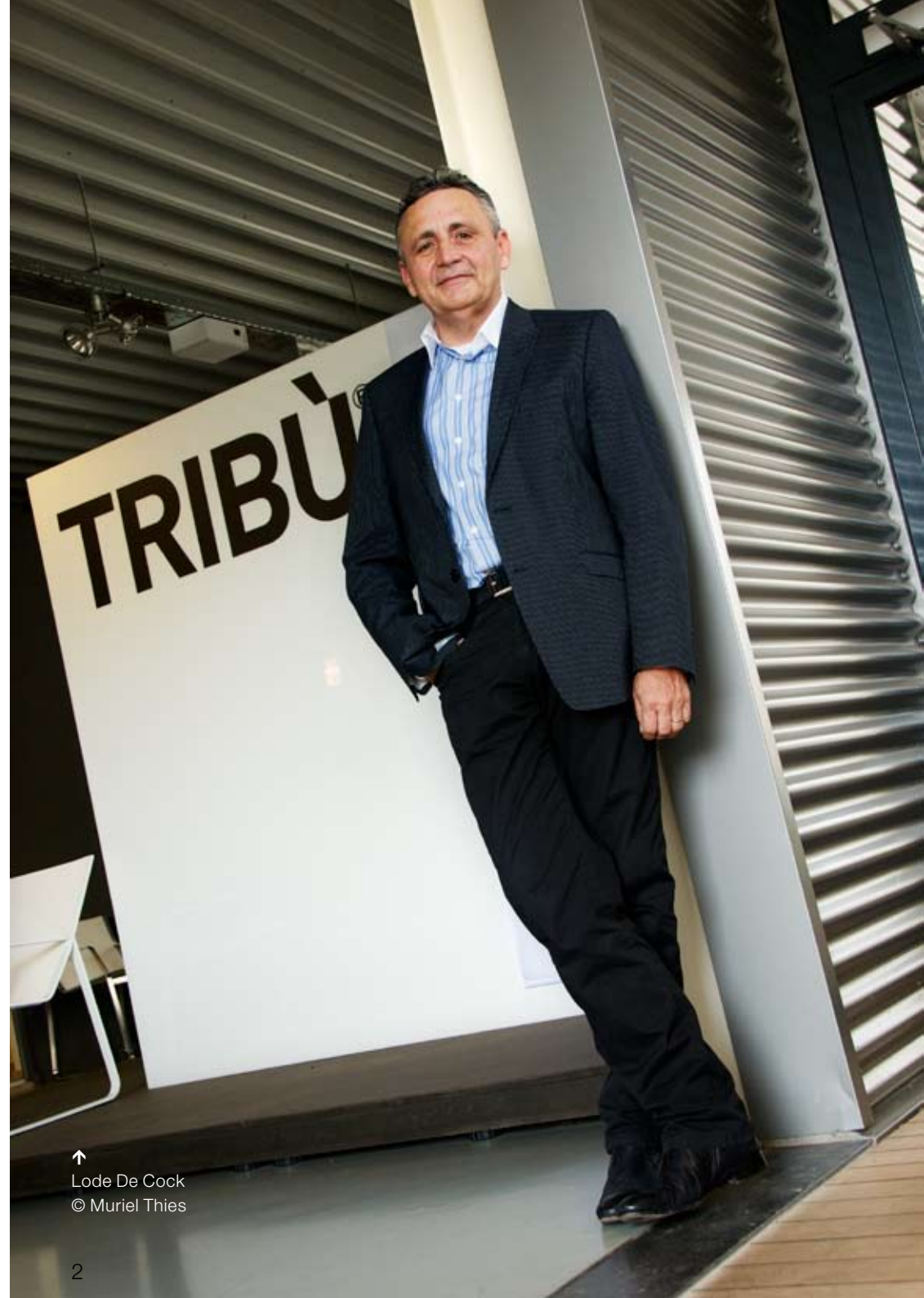
↑ Lode De Cock