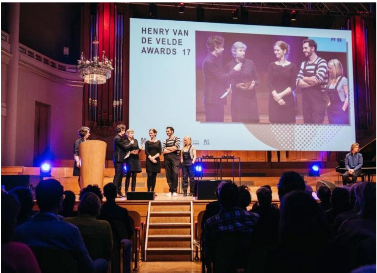
Henry van de Velde, Communication Award – Musée Plantin Moretus & studio Kastaar